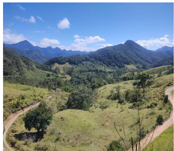
Foto: trecho do Percurso Pró DP 2025

Passando pela região serrana e áreas rurais do município de Casimiro de Abreu, Macaé e Nova Friburgo, o percurso Pró do 8º Desafio do Poeta terá