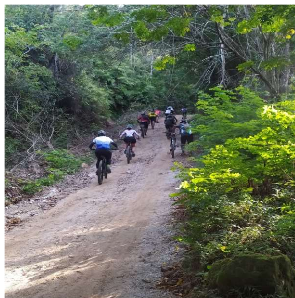
Foto: Percurso Reduzido do Desafio do Poeta 2025